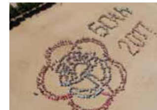
宝塚市立西山小学校(人文字撮影)