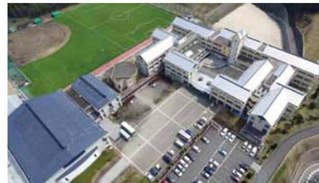
奈良県立五條高等学校創立120周年記念