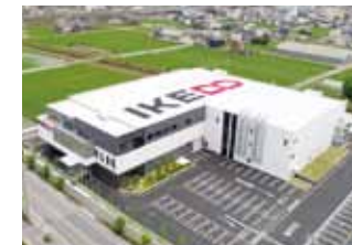
高松建設株式会社(竣工記念撮影)