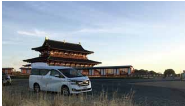
NHK総合テレビ「阿修羅 1300年の新事実」

NHK・テレビ東京などのテレビ番組の1シーンとしてソラカメラが撮影した動画が活躍しています!