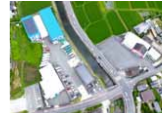
えびの興産株式会社(求人プロモーション撮影)