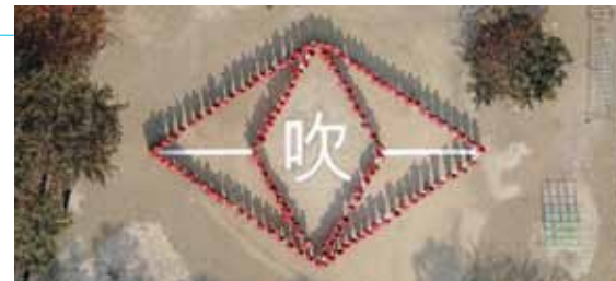
高梁市立吹屋小学校