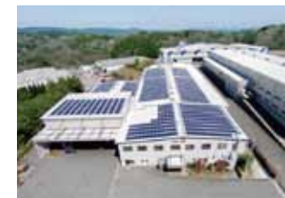
シンコー株式会社(プロモーション撮影)