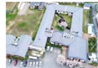
社会福祉法人あおぞら(周年記念撮影)