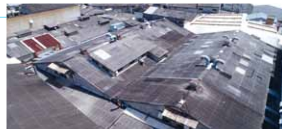
大阪府内某所工場の屋根点検

大規模建造物のリニューアルや耐震補強の場合、適切な施工計画を実施するには現況の確認が必須となります。ドローンの登場により建築物の耐震補強・建替えの事前調査を短時間・低コストで行うことができ、より精度の高い耐震補強計画・建替え計画が可能になりました。