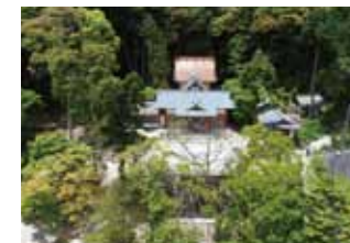
有間神社(プロモーション撮影)