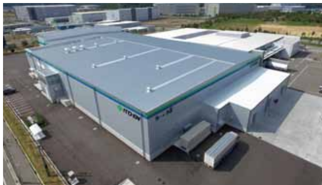
伊藤園神戸工場完成記念

企業や工場からのご依頼で新築竣工記念の記録用撮影をたくさんご依頼いただいています!