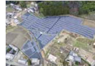
ニシマツホーム株式会社(ソーラーパネル撮影)