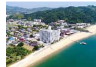
ウエント淡路東海岸(プロモーション撮影)