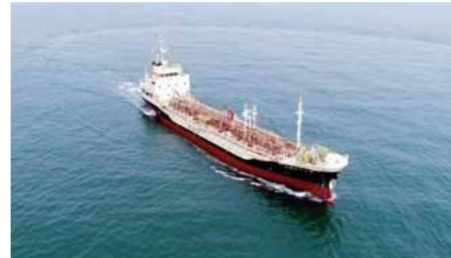
石油タンカー「第十八仲興丸」完成記念

高度なドローン操作技術が必要な海上でのドローンの離発着にも対応可能です。 ※一部条件により海上離発着ができない場合があります。事前にご相談ください。