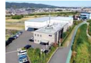
株式会社正英製作所(記録撮影)