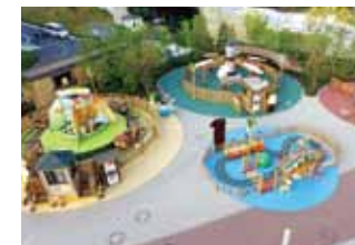
遊園地 エキスポシティ ANIPO(プロモーション撮影)