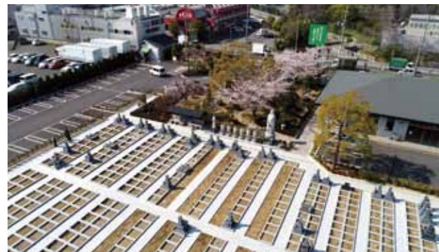
八尾普泉寺霊園プロモーション

営業活動・プロモーションに利用される動画やパンフレット・WEBサイト用の空撮を行っています! 制作会社さんからのお問い合わせも多くあります。