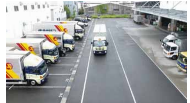
つばめ急便リクルート用動画

リクルート用の動画撮影・編集を行っています。地上カメラも使用することで視点の変化に富んだ動画に仕上がります。