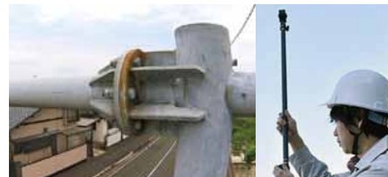
高所点検ロッド Bi Rodによる撮影の様子