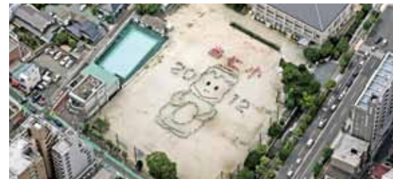
福岡市立当仁小学校