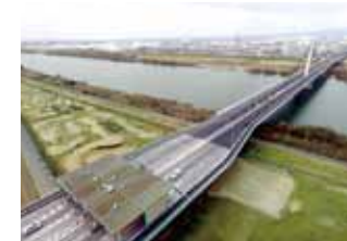
株式会社竹中道路(竣工記念撮影)