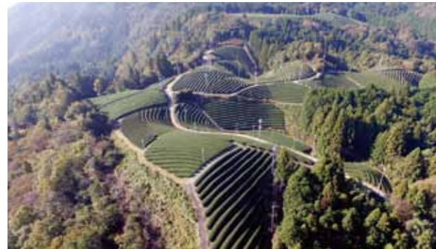
和束町町おこしプロモーション

地域の魅力を再発見するためのプロモーションビデオやプロモーション媒体用写真の空撮でソラカメラが活躍しています!