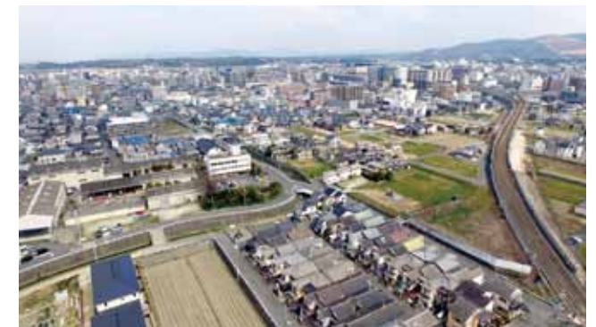
奈良県某所都市開発予想イメージ用撮影

都市開発や大型構造物完成予想図の作成や眺望イメージ撮影など。上空からのドローン撮影で忠実に再現することが可能です。